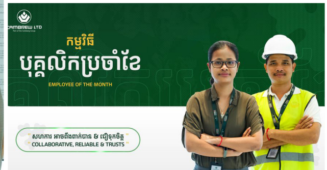
កម្មវិធី បុគ្គលិកប្រចាំខែ